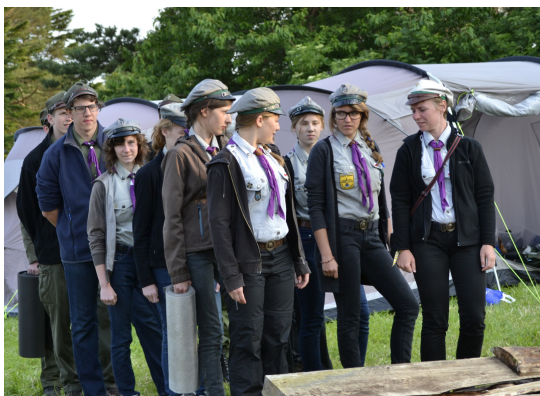
Bildet over viser våre venner fra Polen som vi lærte bedre å kjenne på Landsleiren i Stavanger 2013.